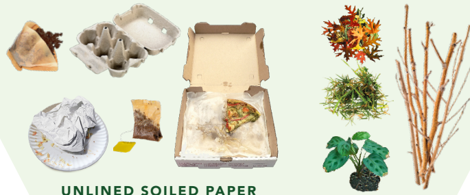
UNLINED SOILED PAPER

Effective January 1, 2022, residents and businesses are now required to compost organic materials on site or through their green Recology compost bin.