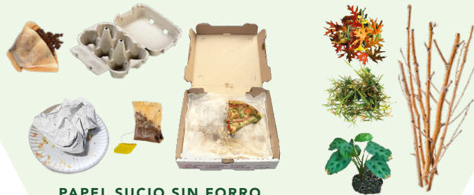
PAPEL SUCIO SIN FORRO

A partir del 1 de enero de 2022, los residentes y las empresas ahora deben compostar materiales orgánicos en el sitio o a través de su contenedor de compost verde Recology.